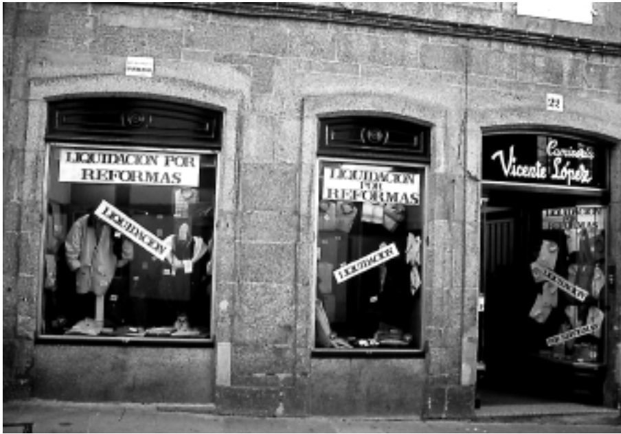
Local comercial en Praza de Cervantes 22.