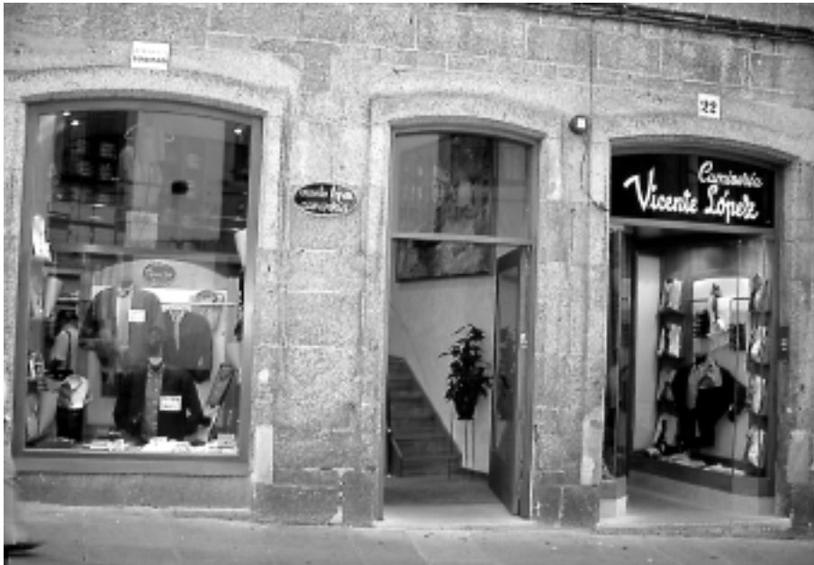
Local comercial rehabilitado en Praza de Cervantes 22.